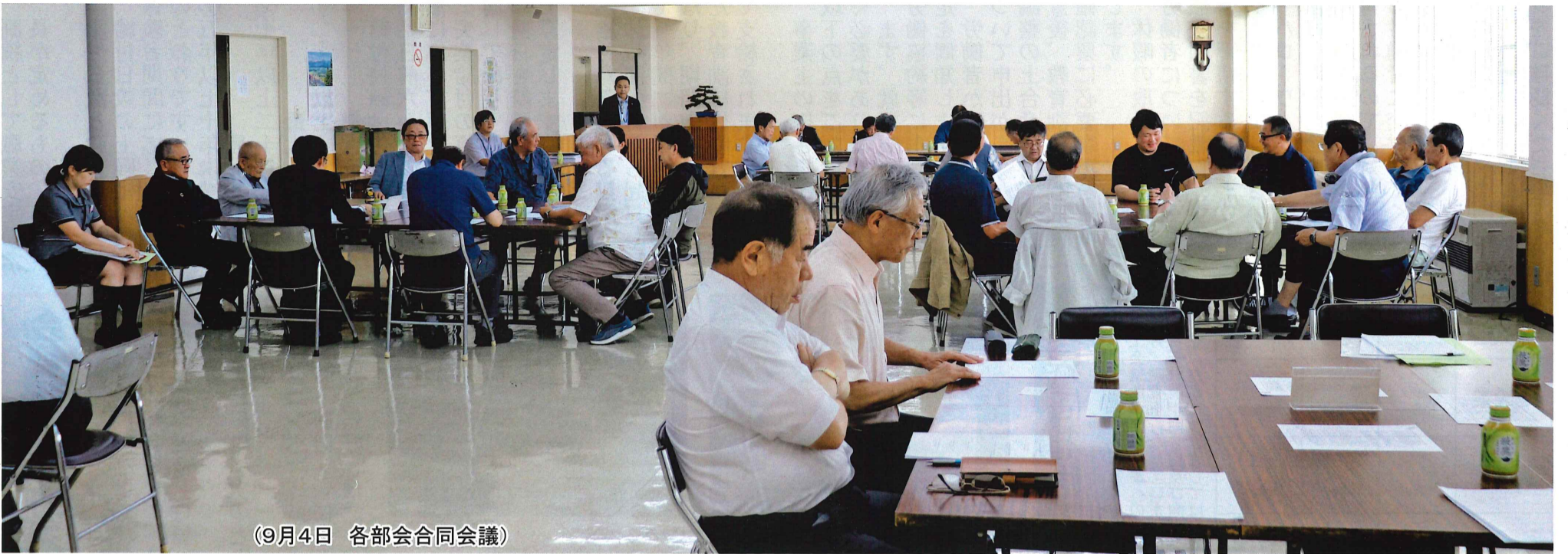
(9月4日 各代会合同会議)