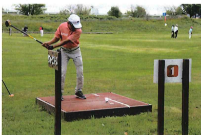
パークゴルフ大会