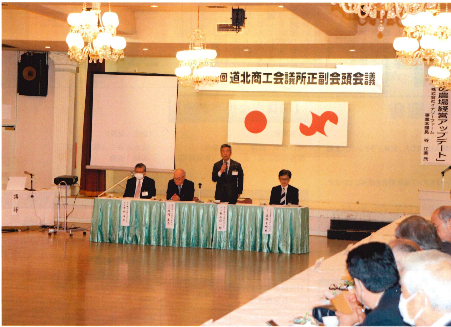
道北商工会議所連合会 新谷会頭挨拶