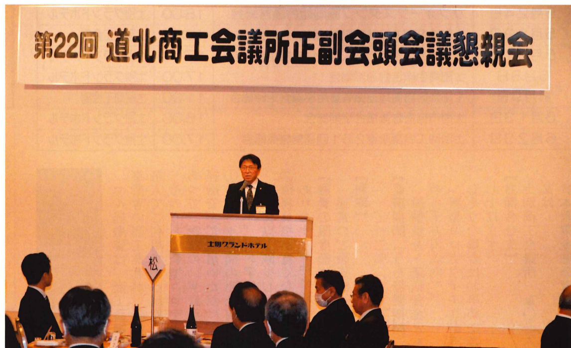
開催地 北村会頭挨拶