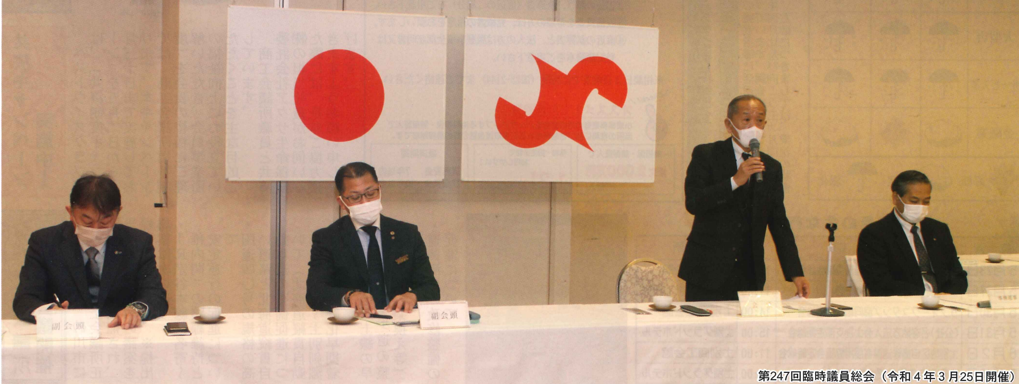
第247回臨時議員総会 (令和4年3月25日開催)