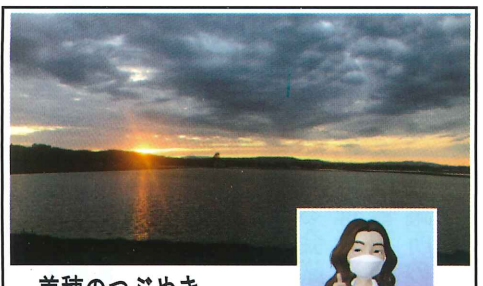
美穂のつづやき @mihotsubucci 士別市 フォロワー24 フォロワー24

美穂のつづやき・2022/05/20 ゴールデンウィークが終わってしまいました! 連休の思い出と言えば、白髪を2本発見したことでしょうか…(とてもショック!)でも抜いたので今は0本!!!!!! さて、5月に入り市内の水田に水が入り出しました。夕方になると水面に夕日が反射して、とても綺麗なんですよ★美味しいお米が食べられる季節が今から待ち遠しいです☺生産者の皆さんに感謝です。ちなみに一番好きなお飯のお供は明太子です(笑)