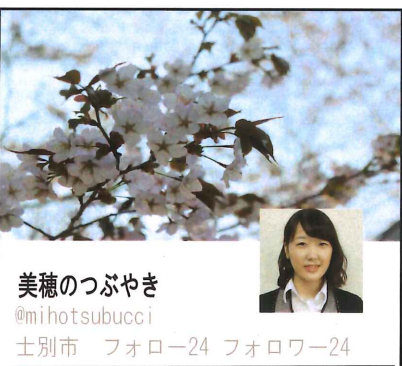
美穂のつづやき @mihotsubucci 土別市 フォロー24 フォロワー24

美穂のつづやき 2020/05/20 最近テレビをつけてもコロナ関連のニュースばかりで気が滅入る毎日ですが、このつづやきが少しでも目にした方々にあってフツと笑えるものであれば嬉しく思います。そんな私の最近の#おうち時間の過ごし方は、料理をしたりこまめに部屋の掃除をしたり、映画を見たりしています。最近見たオススメ映画はクレヨンしんちゃんです。甥と見たのですが、大人でも泣いてしまうのです( ; ; )