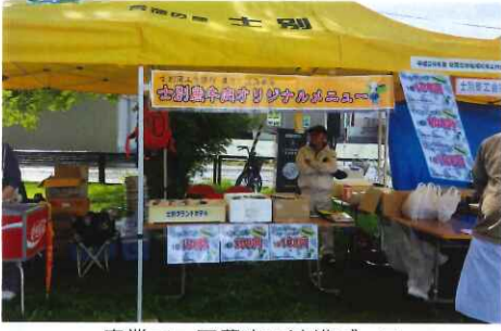
産業フェア農商工連携ブース

食べ歩きラリーの当選者発表については十月中旬を予定しております。また、本事業の実施にあたりご協力いただきました事業者の皆様には厚く御礼申し上げます。今後士別市が抱える課題解決へ向け、農商工連携事業を展開してまいります。