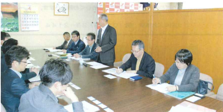
まちなかプロジェクト会議

解体業者の入札はすでに終了しており、今年の八月をめどに基本設計を完成、二〇一九年度内に実施設計を完成させ、二〇二〇年度内に施設の建設が完了、二〇二一年度春のオープンを予定しています。