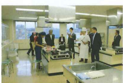
ファーストフードメニュー部門

士別産牛肉の販路拡大と、特産品支援の推進をため、農工商連携事業「士別産牛肉料理コンテスト」を開催し、去る十一月十一日に、市民文化センターにおいて応募作品の実技審査を行いました。市内高校生を対象とした「ファーストフードメニュー部門」と、市民を対象とした「レストランメニュー部門」合わせて七作品の応募があり、参加者は真剣な面持ちで実技審査に臨んでいました。