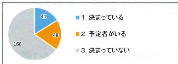
現在、後継者はお決まりですか。(〇は1つだけ)