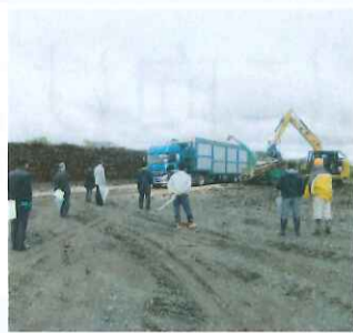
視察研修会の様子

木質バイオマス発電は、現在全国各地のさまざまな規模の発電所で木を使った発電が行われています。市内の民間企業による初めての取組みでもあり、参加者は熱心に耳を傾けておりました。