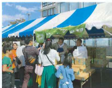
びさいまつりの様子

地元産品の交流や情報交換を通して地域づくりに役立てていくことを目的とし、平成二十八年度から毎年参加しています。「羊」が取り持つ縁で尾西信用金庫と北星信用金庫との「地域活性化に向けた包括的連携協力に関する覚え書きの締結」に伴い、第三〇回びさいまつりへの参加要請があり、当所では広域連携の特産品PRを行いました。