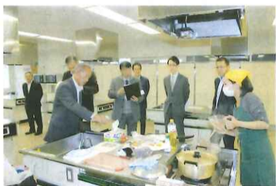
レストランメニュー部門