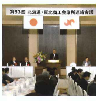
第五十三回北海道・東北商工会議所連絡会議

九月四日、旭川市において第五十三回北海道・東北商工会議所連絡会議が開催されました。東北六県、北海道の商工会議所役員約三百人が出席しました。会議では北海道・東北八十七商工会議所の結束のもと両地域の経済再生と東北の本格復興に向けて全力で取り組むことを確認しました。