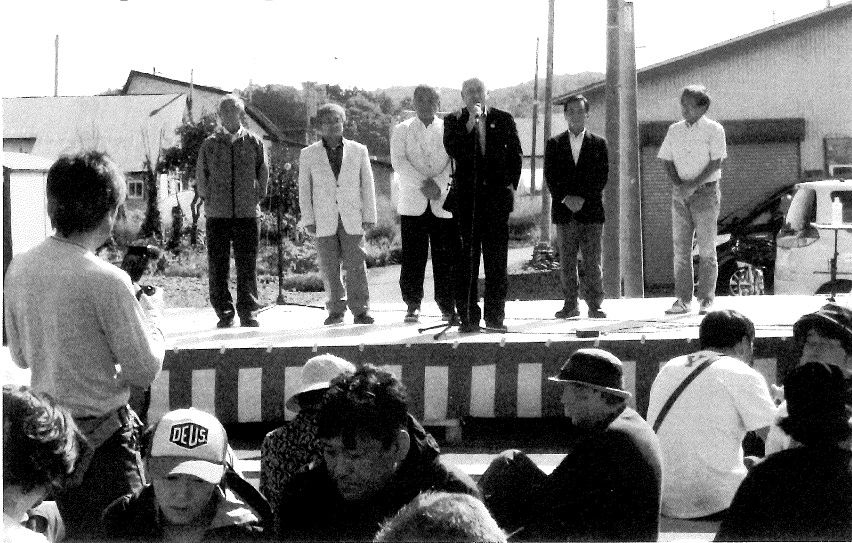
主催者挨拶（士別市長）

～1市3町（士別市、剣淵町、和寒町、幌加内町）の 商工会議所・商工会との連携で各地域の特産品をPR～