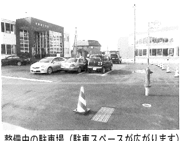
整備中の駐車場（駐車スペースが広がります）

当所会館前の駐車場整備を行っております。完成までの間、大変ご迷惑をお掛けしますが、宜しくお願い致します。