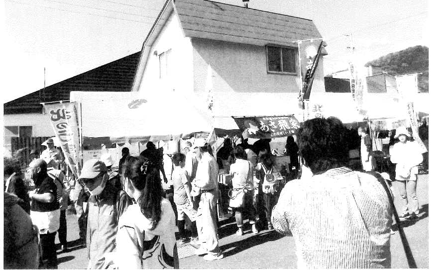
賑わいを魅せる北のうまいもの市会場（10月2日 於 士別市朝日町）

～1市3町（士別市、剣淵町、和寒町、幌加内町）の 商工会議所・商工会との連携で各地域の特産品をPR～