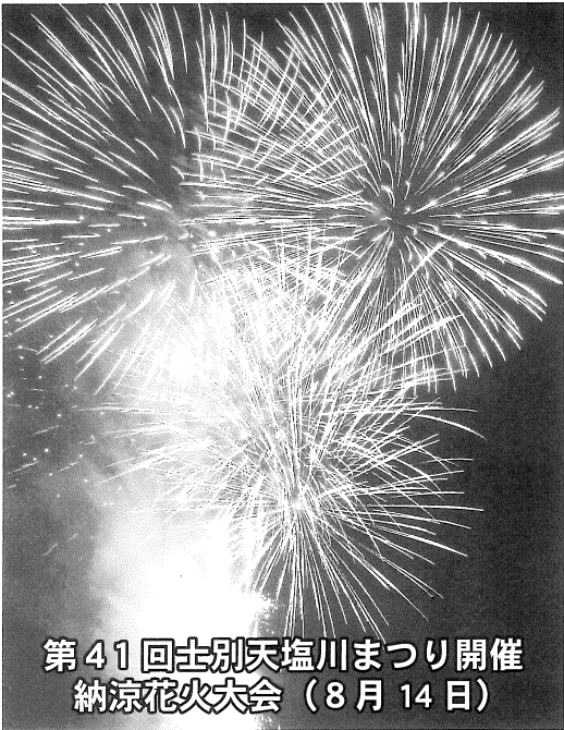
第41回士別天塩川まつり開催 納涼花火大会(8月14日)

北洋銀行主催の「ものづくりテクノフェア2016」の一六が、七月二十一日に札幌市で開催され、当所建設部会が中心となり、全五部会役員への呼掛けで、視察を行いました。同フェアには道内外で最先端のものづくりに取り組む企業約二二〇社が出展、各企業の優れた技術力と製品に参加者は魅了されていました。