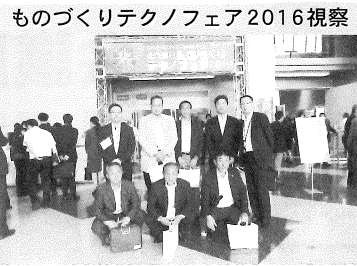
ものづくりテクノフェア2016視察 アクセスサッポロ会場

今後も、士別観光ボランティアガイドの会を中心に、幅広い「観光ガイド」が必要なことから、観光協会などの関係団体との十分な連携のもと、市民意識の醸成をめざすとともに、研修会等を開催するなど、「観光ガイド」人材の養成を図ります。