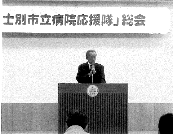
「士別市立病院応援隊」総会

発行 士別商工会議所 〒095-0022 士別市西2条5丁目 TEL (0165) 23-2144 FAX (0165) 23-5417 http://www.shibetsu.ne.jp/shibetsuCCI/ E-mail shibecci@seagreen.ocn.ne.jp 印刷所 田中印刷株式会社