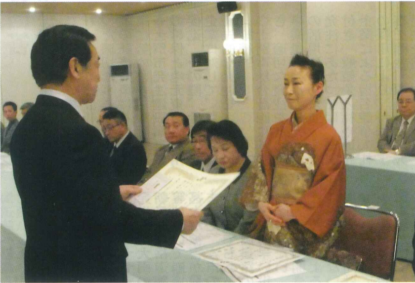
千葉会頭より表彰状・記念品贈呈

第324号 (平成28年3月号) 発行 士別商工会議所 〒095-0022 士別市西2条5丁目 TEL(0165)23-2144 FAX(0165)23-5417 http://www.shibetsu.ne.jp/shibetsuCCI/ E-mail shibecci@seagreen.ocn.ne.jp 印刷所 北海道日報社