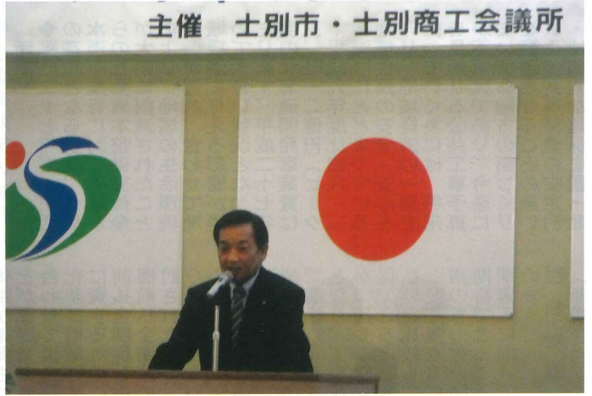
千葉会頭主催者挨拶