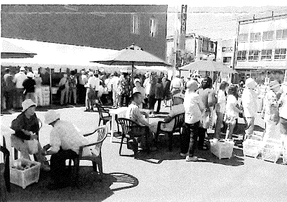
多くの市民で賑わう会場

七月九日に、商工会館に於いて当所役員議員を対象とした、「士別市まち・ひと・しごと創生総合戦略」の策定に向けての研修会が開催されました。研修会では、士別市から当創生総合戦略の大きな柱となる「合宿の聖地創造」、「農業未来都市創造」、「人口ビジョン策定」について説明を頂き、参加者は熱心に耳を傾けていました。