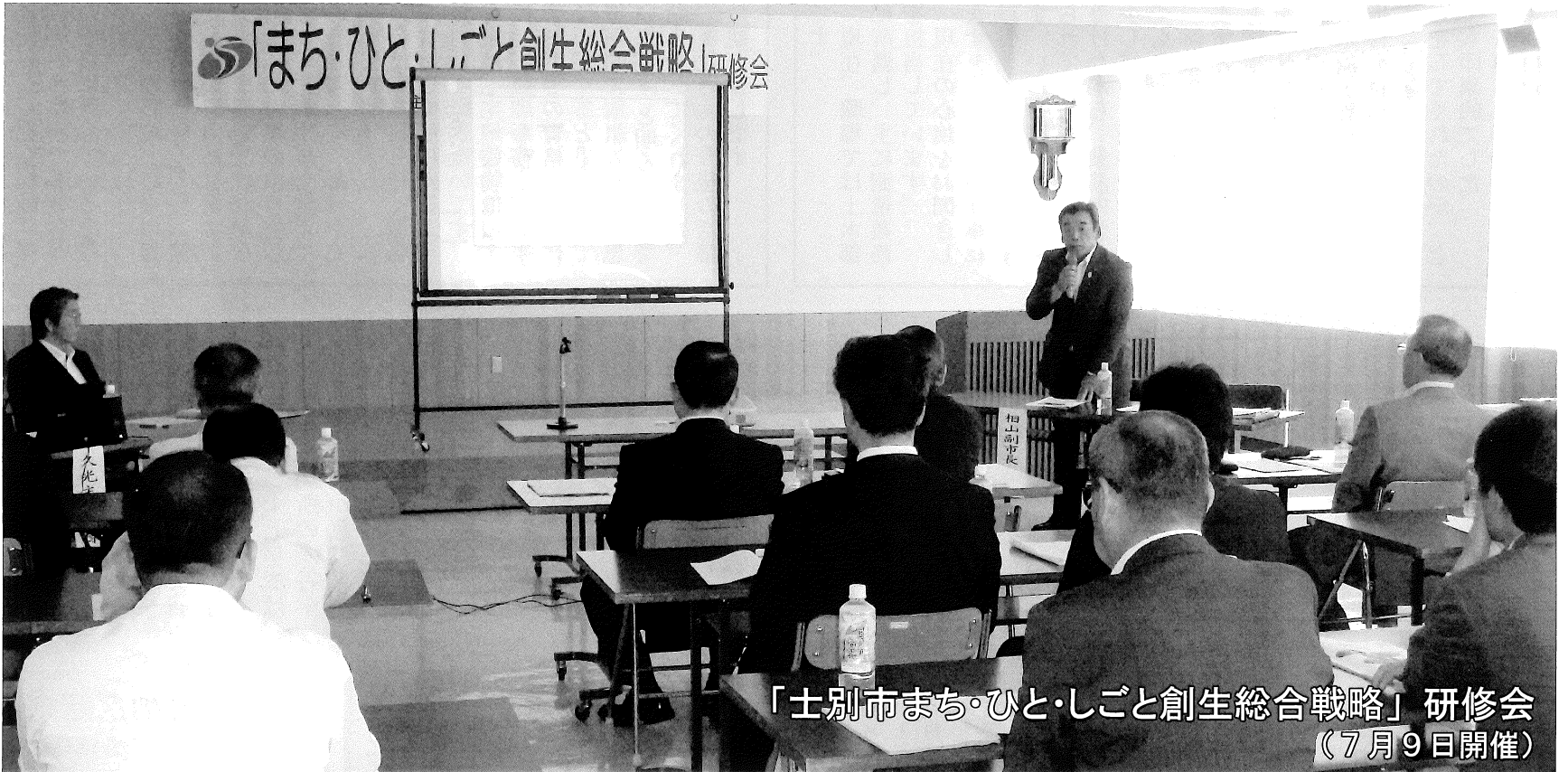
「士別市まち・ひと・しごと創生総合戦略」研修会 (7月9日開催)

発行 士別商工会議所 〒095-0022 士別市西2条5丁目 TEL (0165) 23-2144 FAX (0165) 23-5417 http://www.shibetsu.ne.jp/shibetsuCCI/ E-mail shibecci@seagreen.ocn.ne.jp 印刷所 田中印刷株式会社