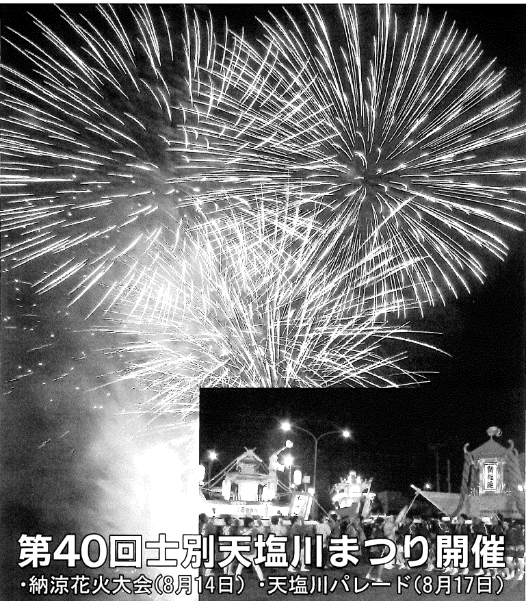
第40回士別天塩川まつり開催 ・納涼花火大会(8月14日)・天塩川パレード(8月17日)

八月二日に北星信用金庫士別中央営業部駐車場に於いて、中心市街地の活性化を目的とした「第一回にぎわい市場」が、にぎわい実行委員会(士別市・士別商工会議所・士別市中心商店街振興組合・サフォークスタンプ協同組合・士別市卸売市場買受人組合士別支部)の主催で開催されました。会場では、新鮮な海産物、野菜、果物の販売や各種抽選会等に訪れる市民で賑わいを見せました。