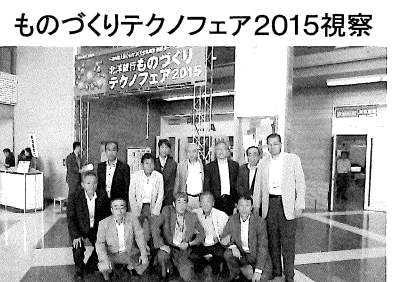
アクセスサッポロ会場

北洋銀行主催の「ものづくりテクノフェア2015」の一五が、七月二十三日に札幌市のアクセスサッポロで開催され、当所建設部会が中心となり、全五部会役員への呼掛けで、十三名が視察に参加しました。同フェアには道内外で最先端のものづくりに取り組む企業約二百社が出展、各企業の優れた技術力と製品に参加者は魅了されていました。