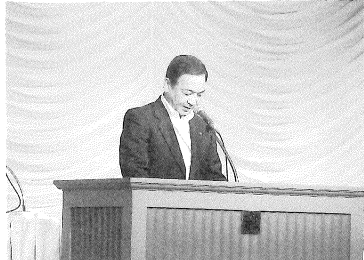
趣旨説明を行う千葉会頭

七月三日に札幌市に於いて、第六十五回全道商工会議所大会が開催され、当所からは三役、役員議員が出席致しました。