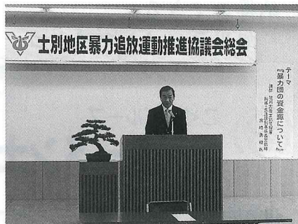
士別地区暴力追放運動推進協議会総会 平成27年5月29日 於 士別商工会館