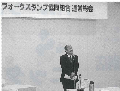
サフォークスタンプ協同組合通常総会 平成27年5月28日 於 士別グランドホテル