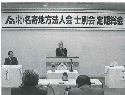
(公社)名寄地方法人会士別支部定期総会 平成27年5月19日 於 士別グランドホテル

マイナンバー制度への対応準備を! 五月十四日、商工会館に於いて、平成二十八年一月からマイナンバー制度が開始されることを受け、講習会を開催致しました。 企業においては、給与所得の源泉徴収票の作成、社会保険料の支払・事務手続きなどでマイナンバーの取扱いが必要となり、対象業務の洗い出しや対処方針の決定等、マイナンバー制度への円滑な対応に向けた準備を行う必要があります。 当所では、部会活動事業として、制度の基礎知識及び対応策等、会員の皆様が円滑に制度導入が図れるよう、第二弾の講習会を開催致しますので、是非ご参加頂きます様、お願い申し上げます。