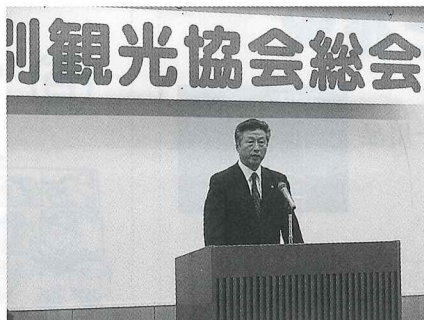
士別観光協会定期総会 平成27年5月22日 於 士別商工会館