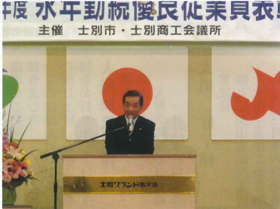
(千葉会頭主催者挨拶)