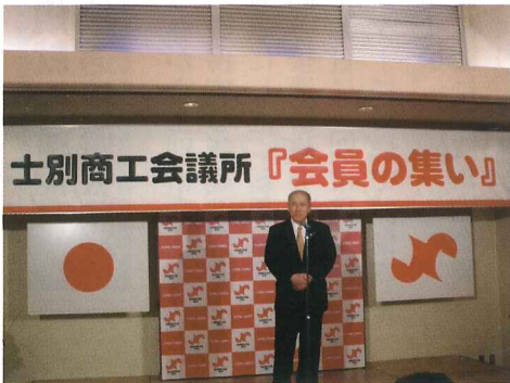
(来賓牧野市長挨拶)