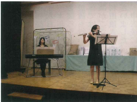
(フルーツとピアノ演奏)