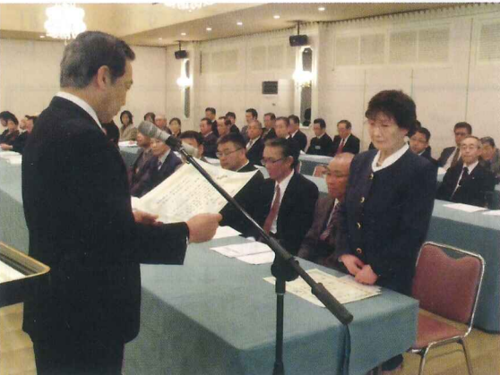
(千葉会頭より表彰状・記念品贈呈)