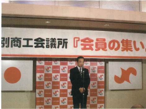
(千葉会頭主催者挨拶)

第312号 (平成27年3月号) 発行 士別商工会議所 〒095-0022 士別市西2条5丁目 TEL (0165) 23-2144 FAX (0165) 23-5417 http://www.shibetsu.ne.jp/shibetsuCCI/ E-mail shibecci@seagreen.ocn.ne.jp 印刷所 道北日報社