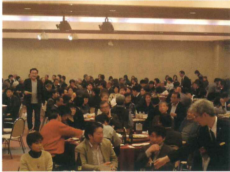
(テーブルゲームで盛り上がる)