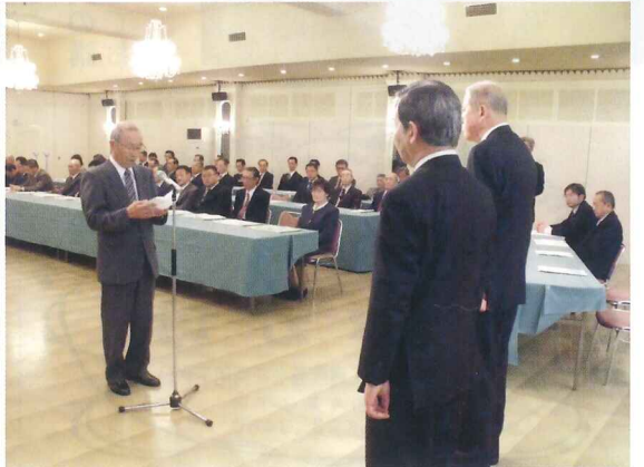
(受賞者代表謝辞 ㈱士別ハイヤー 妻鳥様)